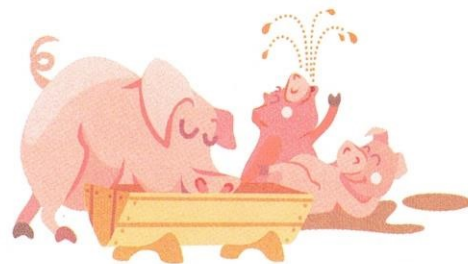
świnia / prosiak