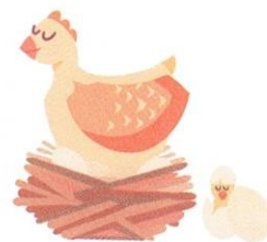
kura / kurczak