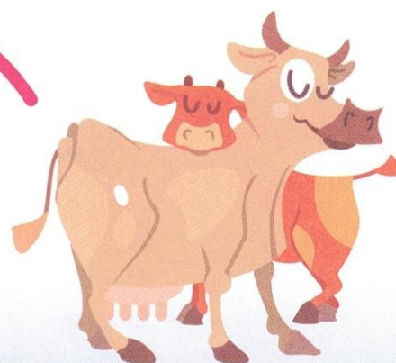
krowa / cielak