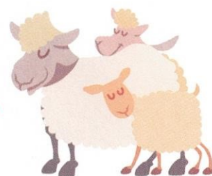
owca / jagnię